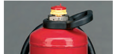
Abb. 1 Wandhalter Abb. 2 Fußring Abb. 3 Ventilarmatur mit Tragegriff und Schlagknopf