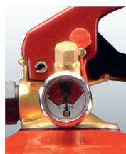
Manometer und Prüfventil